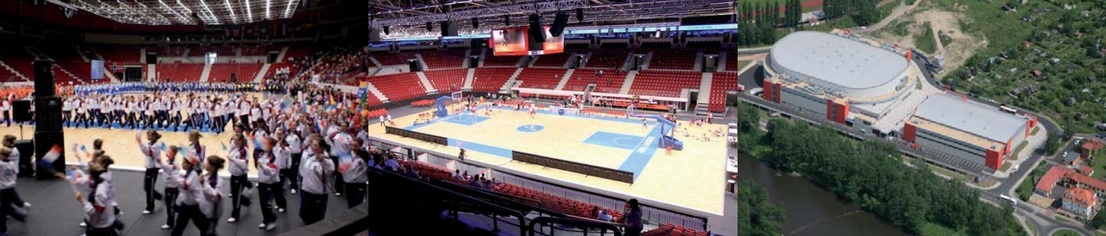
fotografie interiéru a exteriéru karlovarské KV Areny • více najdete na www.kvarena.cz